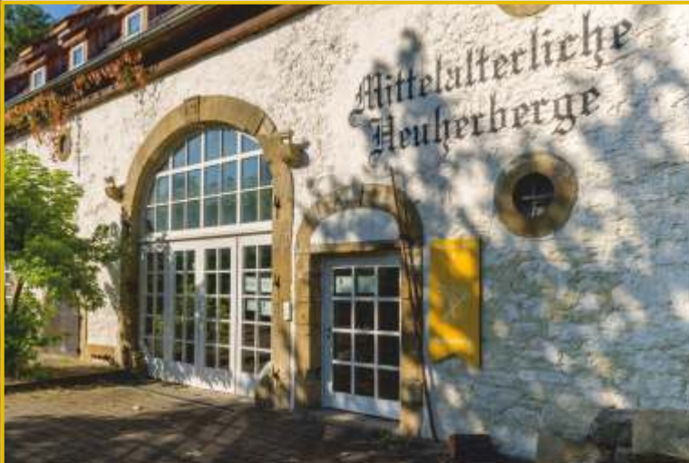
Eingang zur Herberge